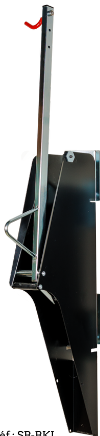
Réf : SB-BKL